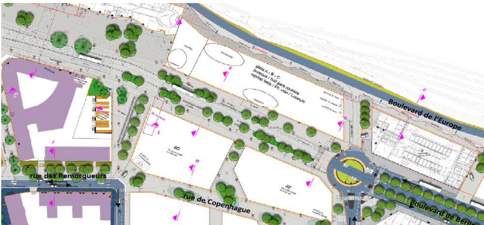
Extrait du plan d'aménagement d'Euronantes montrant le prolongement du bd de Berlin vers le parvis de la gare à l'ouest ainsi que les îlots à construire de part et d'autre © Nantes Métropole Aménagement – Atelier Ruelle (nov. 2020)

Le nouveau quartier ne manque pas de logements sociaux, ni même de logements sociaux avec vue sur Loire : en 2027, il y aura 4 600 logements, dont 48 % de logements sociaux. Auxquels il convient d'ajouter les logements à prix abordable ou spécifiques, au Pré-Gauchet (une résidence service et le futur hôtel) comme à Malakoff (une résidence étudiante et le futur centre international de séjour de la fédération des amicales laïques FAL 44).