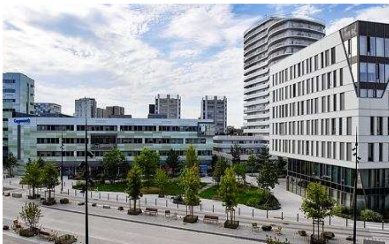
Le bd de Berlin vu depuis le parking Gare Sud 2

Début 2021, SNCF Réseau a mis en service son nouveau centre de télécommunication ferroviaire dans l'immeuble Viseo, à côté du parking public « Gare Sud 2 ». L'ancien centre a été démoli d'avril à juillet, permettant entre septembre et décembre de connecter le boulevard de Berlin au futur parvis sud de la gare. Ce nouveau boulevard intègre une plateforme centrale de transports collectifs – dits en site propre – qui accueillera en 2022 le busway ligne 5, le chronobus C3 (qui circulent aujourd'hui sur le mail Picasso) et le chronobus C2. Il offrira une piste cyclable sécurisée et de larges trottoirs permettant aux piétons de cheminer directement de la gare sud vers la Petite-Amazonie sans contourner l'actuelle gare routière.