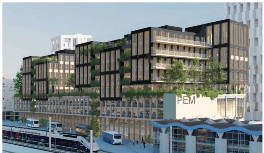
L'îlot ABC vu depuis la gare-mezzanine © AIA - Dream.

Cet îlot ABC du projet Euronantes est porté par Nantes Métropole Aménagement pour la partie gare (PEM) et Bati-Nantes pour la partie bureaux. Il est conçu par les architectes d'AIA Life Designer et de Dream (permis de construire délivré début 2022). Il sera construit par ETPO Entreprises, mandataire du groupement de conception-réalisation. La partie tertiaire du bâtiment vise un objectif E3C2, avec une structure bois, une façade en tuiles et une attention particulière portée aux matériaux biosourcés et recyclés. Le rez-de-chaussée et sa mezzanine joueront sur les transparences pour favoriser l'animation du quartier et la compréhension des lieux et des usages : du parvis ou du boulevard, les piétons verront la gare routière, ses quais de cars et le parking à vélos.